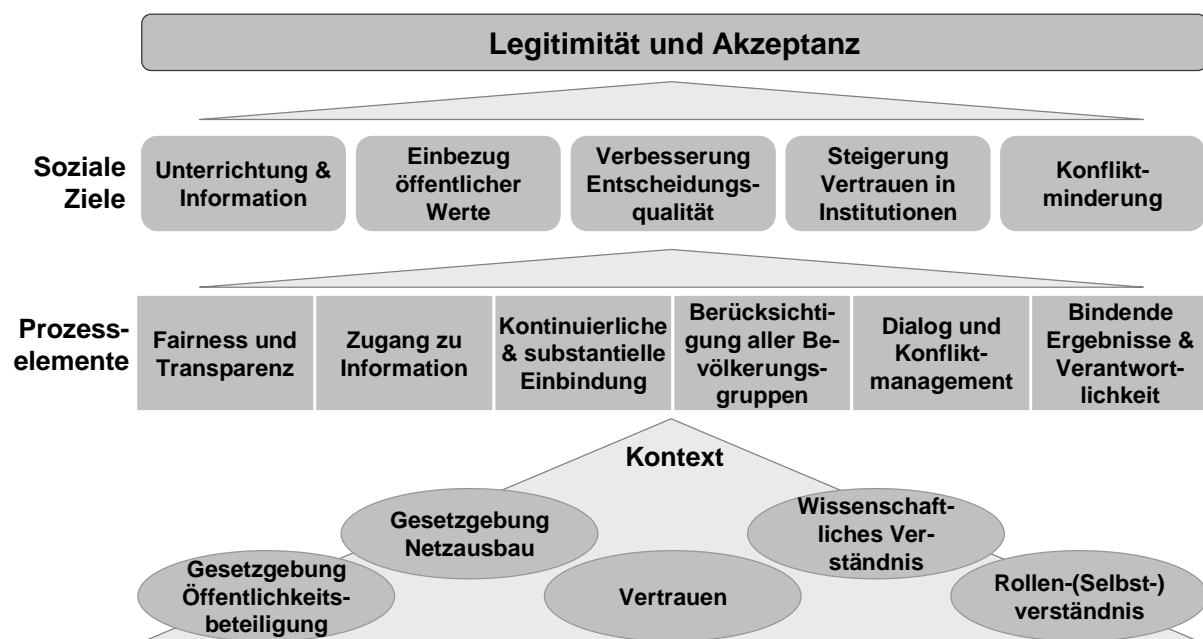
Bewertungsrahmen (vereinfachte Darstellung)

Infolgedessen können Mängel beim Erreichen jedes der fünf sozialen Ziele festgestellt werden. Die Öffentlichkeit ist nicht ausreichend unterrichtet und informiert über die grundsätzliche Notwendigkeit des Netzausbaus und die wirtschaftlichen und technischen Details möglicher Alternativen. Gewisse lokale, aber auch nationale öffentliche Werte erhalten wenig Aufmerksamkeit , stattdessen beeinflussen vor allem Interessen der Netzbetreiber und Kostenfragen das Ergebnis vieler Entscheidungen. Der späte Einbezug der Bevölkerung kann die Möglichkeiten behindern, die Qualität von Entscheidungen maßgeblich zu verbessern , indem auf lokales Wissen eingegangen wird. Behörden werden als parteiisch oder hilflos im Umgang mit den Netzbetreibern wahrgenommen, was das Vertrauen in Institutionen unterminiert . Wie die Debatte in den Medien reflektiert, ist Konflikt auf nationaler Ebene im Ansteigen , statt aktiv gehandhabt und gelöst zu werden.